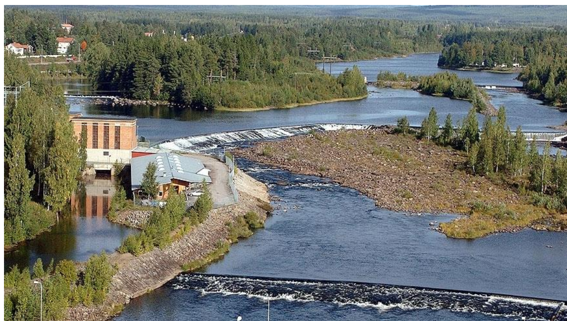
Bollnäsströmmarna, Ljusnan.

Forskningen genomfördes i dialog med intressenter kring Emån och Ljusnan.